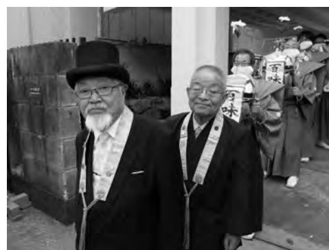
二人ともお似合いです