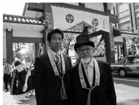
きれいになった大門前で