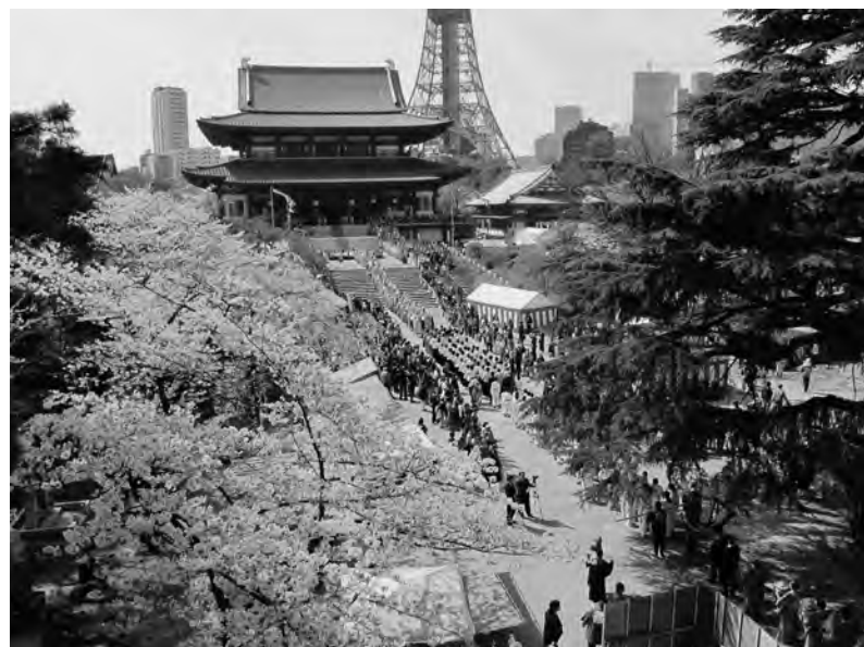
三門より桜と大殿